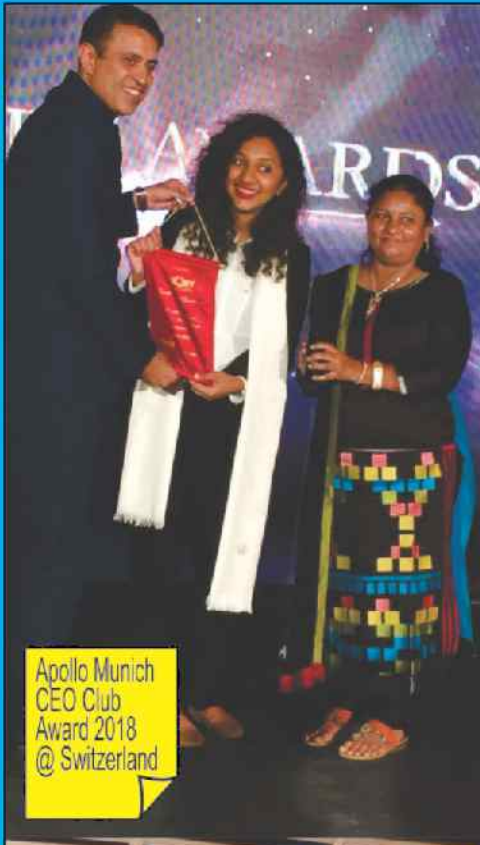
Apollo Munich CEO Club Award 2018 @ Switzerland