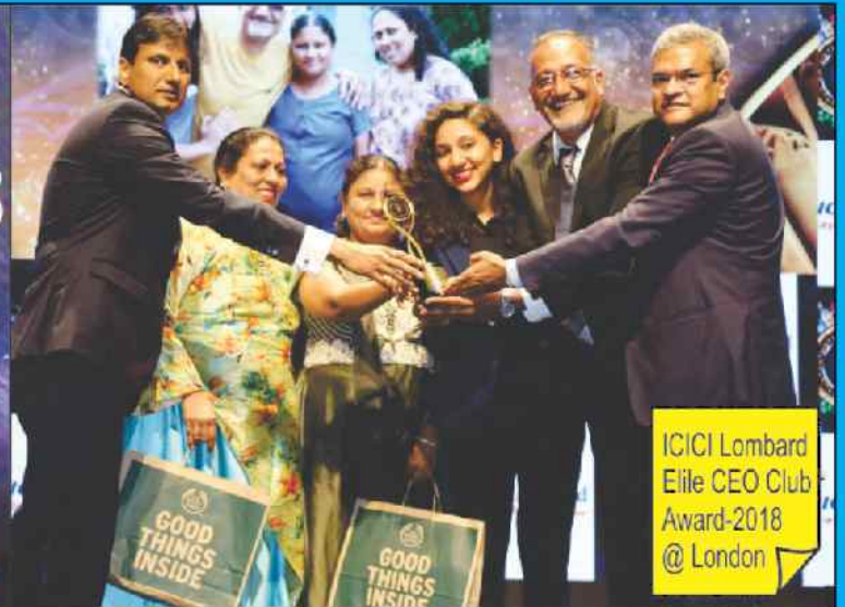
ICICI Lombard Elite CEO Club Award-2018 @ London