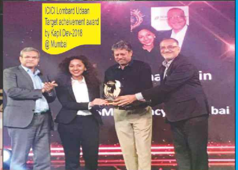
ICICI Lombard Udaan Target achievement award by Kapil Dev-2018 @ Mumbai