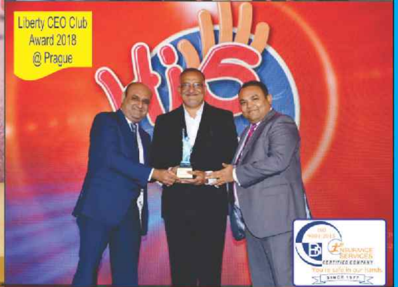
Liberty CEO Club Award 2018 @ Prague