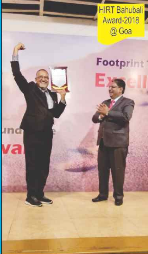
HIRT Bahubali Award-2018 @ Goa